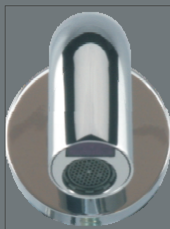
Design Perlator Eingebaut. Diebstahlsicher.