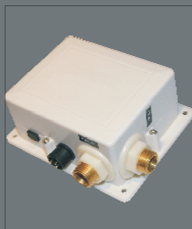
Hauptkomponenten sind in einem Steuerkasten zur Montage unter dem Waschtisch angebracht. Ebenfalls mit einem Batteriefach oder Trafo versehen. Abmessung b x h x d: 150 x 120 x 63 mm